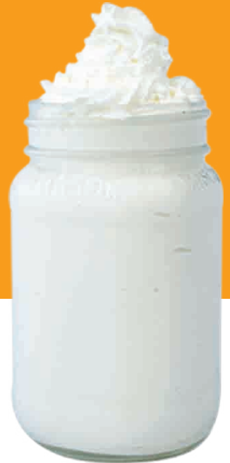
FRAPPÉ DE COCO $67