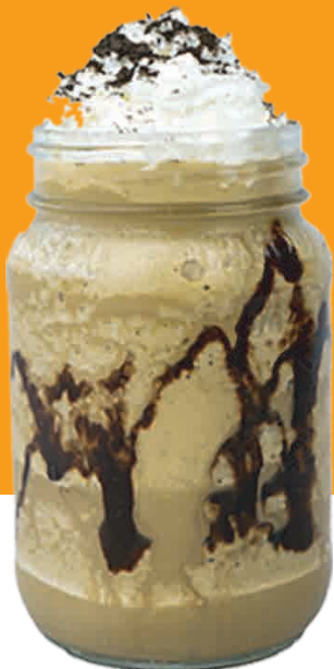
FRAPPÉ DE CAFÉ $67