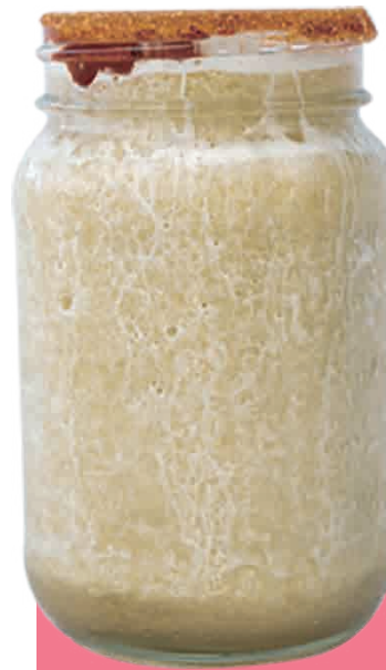
FRAPPÉ DE TAMARINDO $67