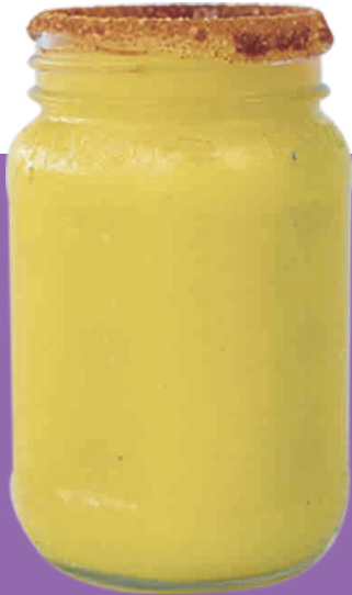
FRAPPÉ DE MANGO